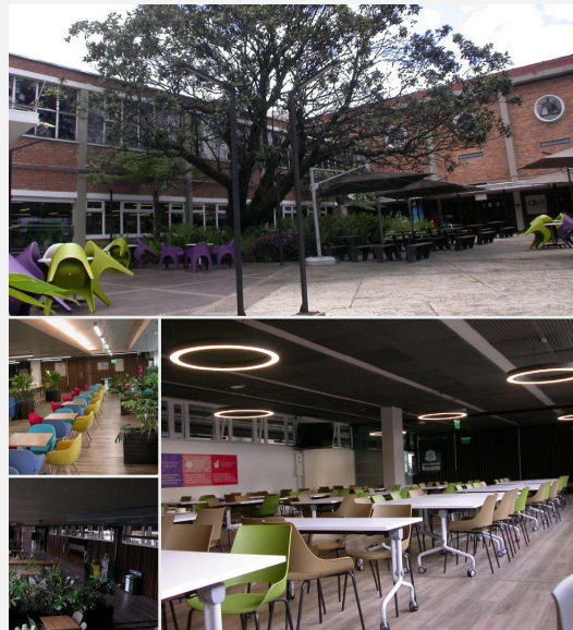
Espacios destinados para el almuerzo

Las tarifas de inscripción presenciales incluyen el almuerzo en la sede del evento. Esto facilita espacios de interacción entre los/as asistentes, brindando la oportunidad de organizar almuerzos de trabajo. Además, las opciones de restaurantes cerca del lugar del evento se encuentran principalmente en el sector de "Galerías", lo que implica desplazamientos de 30 a 40 minutos de ida y vuelta, haciendo que el almuerzo en la sede del evento sea una opción conveniente para los/as asistentes y el desarrollo del evento.