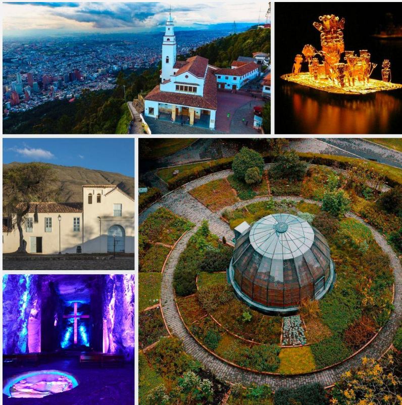
Cerro Monserrate (Foto de Viator), Museo del Oro (Foto de Tripadvisor), Claustro de San Agustín, Colecciones Biológicas del Instituto Humboldt, Villa de Leyva (foto de Instituto Humboldt), Catedral de Sal, Zipaquirá (Foto de Tripadvisor), Jardín Botánico de Bogotá (Foto de bogotadc.travel)

Explore Bogotá y sus alrededores con la siguiente lista de actividades turísticas sugeridas: