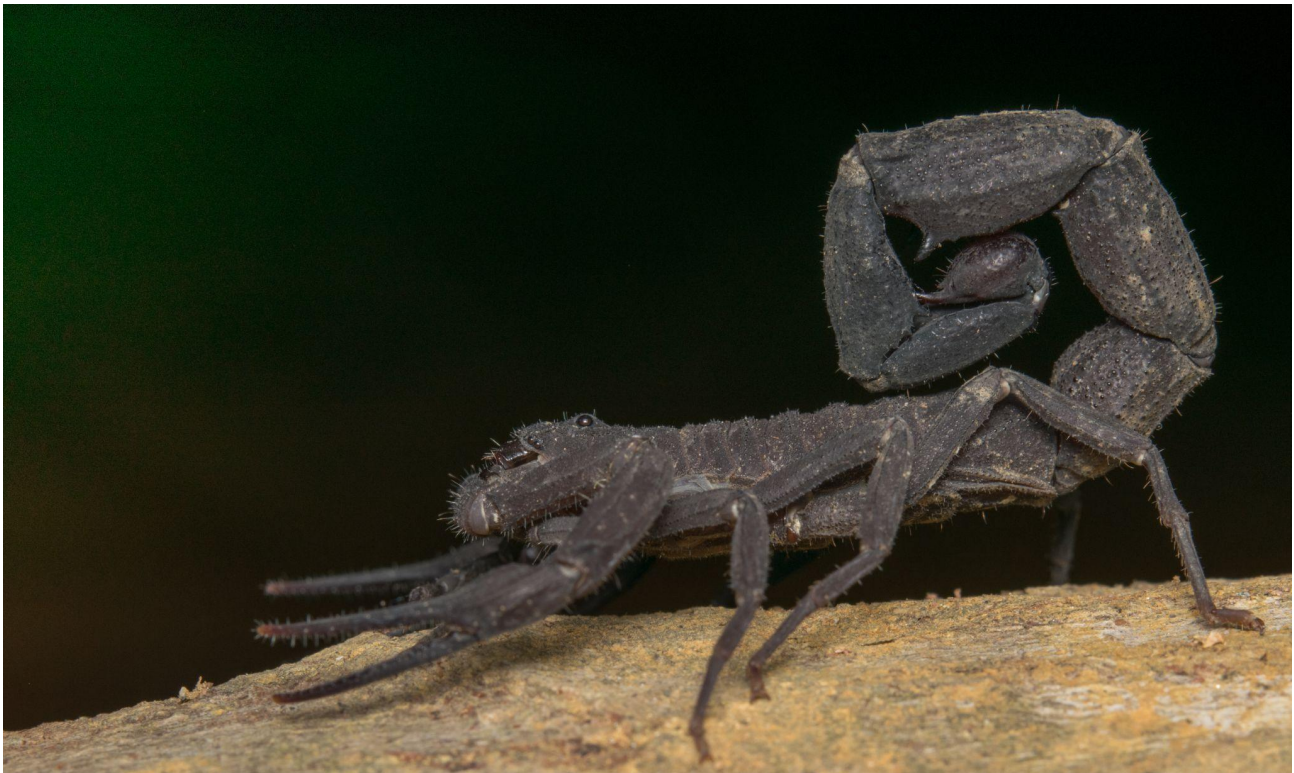
Tityus aff. forcipula (Buthiidae).

El VII CLA busca activamente patrocinadores para el evento. Hemos desarrollado un plan variado de patrocinio y exposición comercial para asegurar la participación y el apoyo de diversas entidades, empresas, instituciones y emprendedores/as, contribuyendo así al desarrollo del congreso. Si está interesado en apoyar o mostrar su marca y productos durante el evento, por favor contáctenos para recibir información detallada sobre nuestro portafolio.