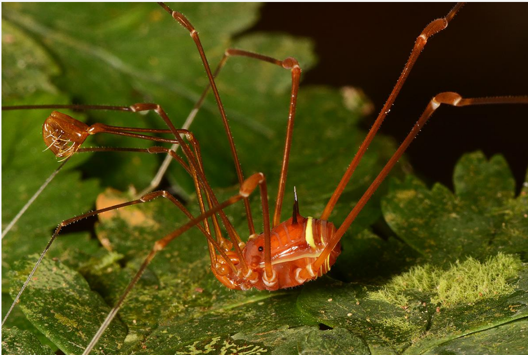
Protimesius sp (Stygnidae).

Información adicional sobre los cursos se proporcionará en la próxima circular.